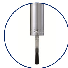
柔らかくしなやかな毛質のハケ

爪の上のにせた瞬間に広がる、柔らかくしなやかな毛質のハケ。 塗りムラ・スジもできにくく、簡単に美しい仕上がりを実現します。