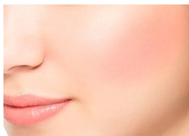
01 フレッシュコーラル 上品ナチュラルなコーラルピンク