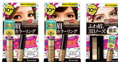
10周年記念 限定セット

2008年のスタートから好評いただき、2018年2月で、ブランド誕生10周年を迎えました。