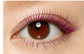
限定色: モーヴピンク