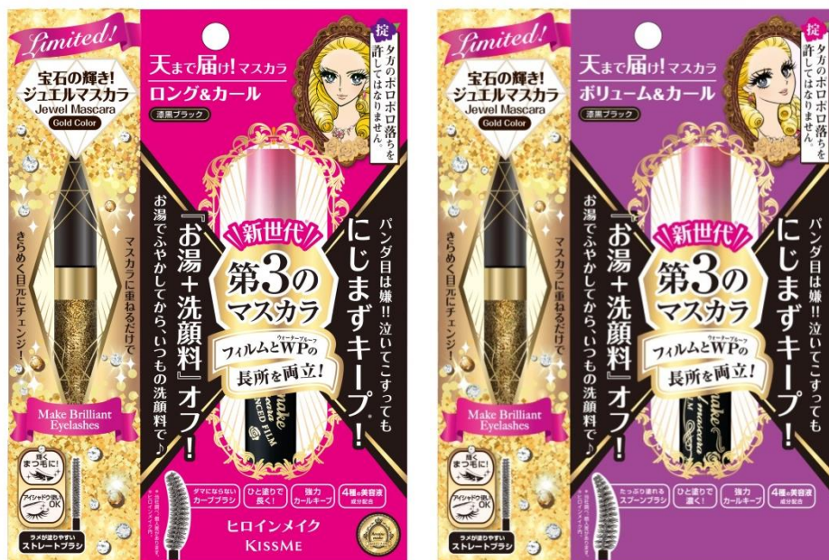
(画像はイメージです)

耐久カールとラクOFFのどちらも叶える大人気「第3の mascara」に、 トレンドのグリッターメイクが楽しめるラメマスカラがついた限定セットが登場！ キラめく目もとを演出するゴールドラメと、瞳をクリアに魅せるブルーラメで、まるで宝石をまとったようなまつ毛に。 パーティーシーンで一番輝くヒロインになれる、この冬だけのスペシャルセットです。