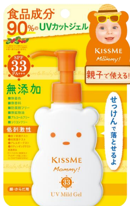
マミー UVマイルドジェルN (ジェルタイプ)

食品成分※ 1 にこだわってつくったスキン&ボディケアシリーズ「マミー」の 大人気日やけ止めシリーズ「マミー UVマイルドジェル」と「マミー UVアクアミルク」が 子ども用UVシリーズ販売個数第1位※ 3 を獲得しました。