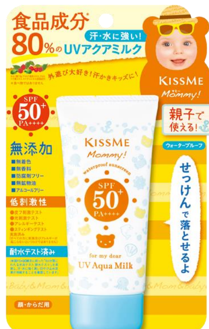
マミー UVアクアミルク (ミルクタイプ)

※ 1 食べ物ではありません。 ※ 2 無着色・無香料・防腐剤フリー・無鉱物油・アルコールフリー・シリコンフリー(シリコンフリーはUVマイルドジェルのみ) ※ 3 True Data チャネル:全国ドラッグストア カテゴリ:子ども用UV 期間:2018年6月~2018年8月