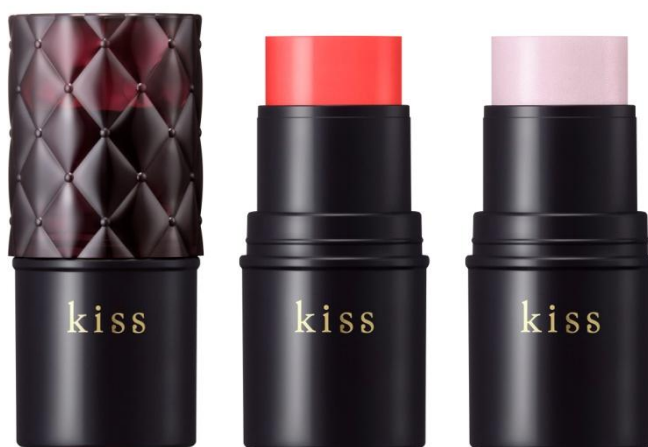
(画像左から キス マルチチークスX 01、キス ルミナイザーX 01)

ほお・唇・目もとなどマルチに使えて、上気したような血色感を与えるクリームカラーと、自然な立体感とツヤをプラスするルミナイザーに、限定色が登場！ 繊細なラメがきらめくピンクカラーのチークと、上品に艶めくモーヴカラーのルミナイザーで、華やかで立体的なフェイスに仕上がります。