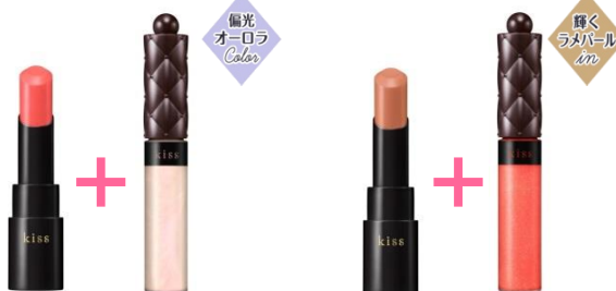
ヴェールリッチルージュ グロウX 01 ヴェールリッチルージュ グロウX 02 ニュアンスラスタースターグロス 12 ニュアンスラスタースターグロス 13