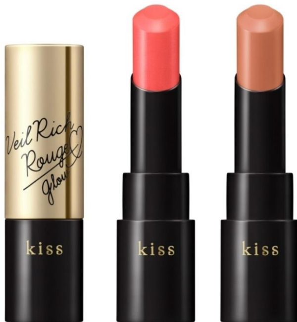
(画像左から ヴェールリッチルージュ グロウX 01、ヴェールリッチルージュ グロウX 02)

昨年10月の発売以来、なめらかな塗り心地と美発色にご好評をいただいている kissのシンボリックなルージュ「ヴェールリッチルージュ」グロウタイプから、 みずみずしくツヤめくコンサバティブなカラーが数量限定で登場！ うるおいを逃さない構造で唇にピタッとフィットして、美しい発色と仕上がりを長時間キープ。 春夏の口もとをレディライクに彩ります。