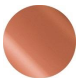
02 Warm Beige 抜け感のある 上品ベージュ