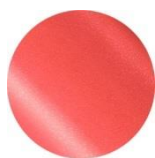
01 Muse Pink 美人度アップの 大人ピンク