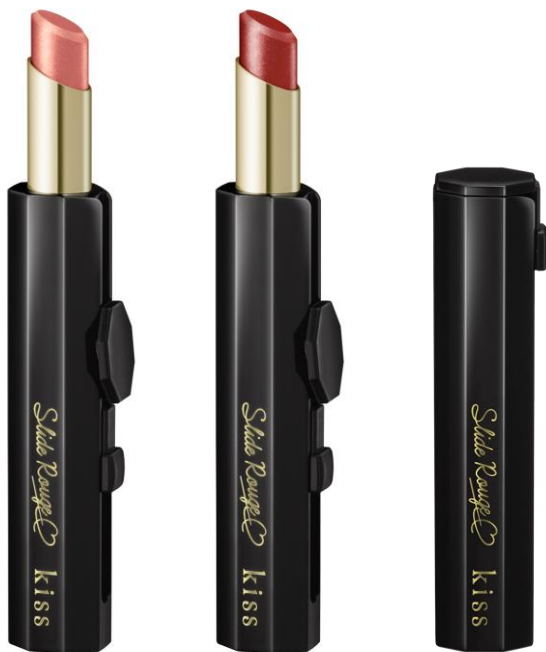
(画像左から スライドルージュX 01、スライドルージュX 02)

すぐにリップメイクを直したいパーティシーンでも、 ボタンをスライドさせるだけで、片手でスタイリッシュに使える落ちにくい美発色ルージュです。