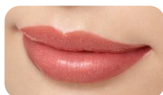
X 01 Fashion Check