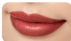
X 02 Wine Night