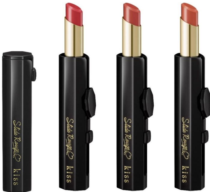
(画像左から スライドルージュ12、13、14)

ボタンをスライドさせるだけで、片手でスタイリッシュに使える美発色ルージュから、 トレンド感がありながら、日常のメイクに取り入れやすいベーシックな3色が新登場！ つけたての美しい発色とうるおいを長時間キープし、キレイな仕上がりが続く。 ひと塗りするだけで、オフィスメイクにもぴったりの洗練された印象のリップメイクを叶えます。 新3色が加わり、スライドルージュは全14色のカラーラインナップとなります。