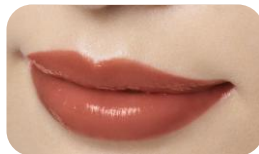
13 Cocoa Brown (ココアブラウン)