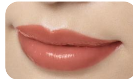
14 Cinnamon Tea (シナモンティー)