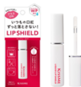
キスミー リキッドリップシールド 6g ¥1,000 (税込¥1,100) メーカー希望小売価格 2020年12月8日(火)全国発売