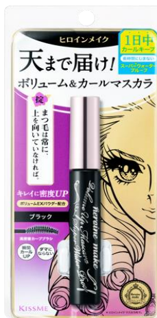
ヒロインメイク ポリウムUPマスカラ スーパーWP