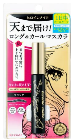
ヒロインメイク ロングUPマスカラ スーパーWP

大人気のスーパーWPマスカラが、 もっとにじまず、さらにキレイに仕上がるヒロインメイク史上最高※1傑作として新登場。 さらに、すご落ち！マスカラリムーバーもパッケージデザインをリニューアル。