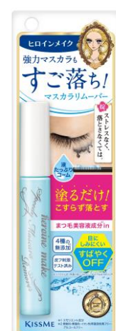
スピーディーマスカラリムーバー