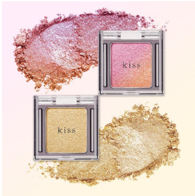
上段:X 51 SKIP A BEAT 下段:X 01 LEMON SNOW

まぶたに溶け込むシアーな発色の中で、 見る角度や光の当たり方によって多彩にキラめく繊細ラメが、目もとにエレクトリックなときめきを与えます。 デイリーメイクの“平日ラメ”としてはもちろん、指でポンポンとのせ、華やかさ・大胆さをプラスする “指ぼんラメ”としてもおすすめ。印象的なアイメイクをお楽しみいただけます。