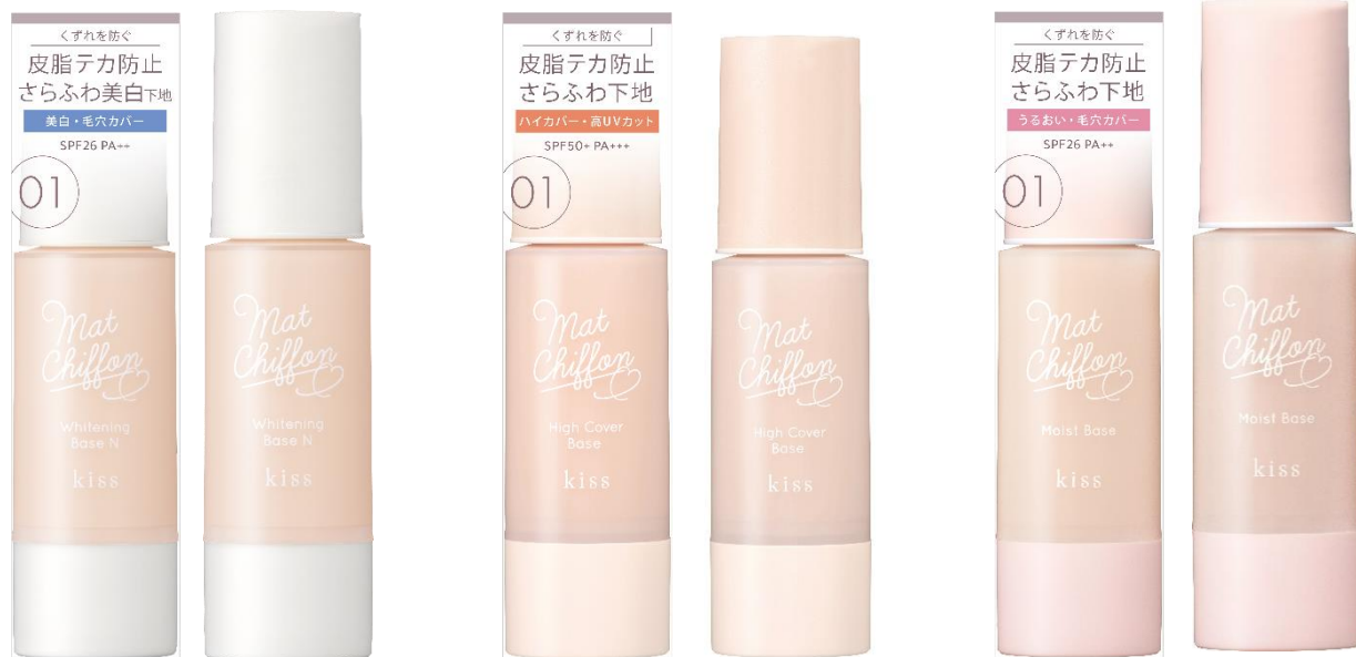
マットシフォン UVホワイトニングベースN 〈医薬部外品〉

大人気ロングセラー商品のマットシフォンシリーズのベースアイテム3種が、 外装パッケージと容器のデザインをリニューアル！ 肌悩みに合わせて選びやすい統一感のあるシンプルなデザインに生まれ変わりました。