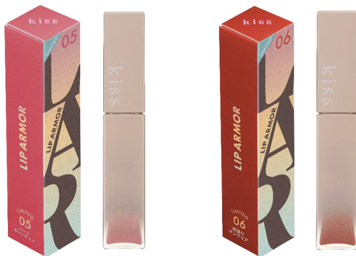
左から 05 ハートキャッチャー、06 欲張りサンングリア

今までになかった“ツヤ×うるおい×落ちにくい”仕上がりで人気の次世代ティントリップから、 バイタリティに満ちた爽快感溢れるハイバイブスなカラーが数量限定で新登場！ 色っぽさを纏いながら、ヘルシーで意志を感じる春メイクに仕上がります。 唇に色が密着し、「透明ジェル膜」が唇をコート。濡れたような光沢感がありながら、ティッシュオフしなくても 色移りせず、つけたての発色が1日中※1続きます。