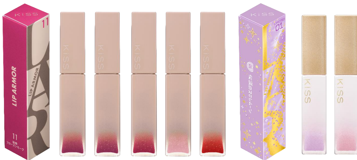
左から リップアーマー 10・11・12・13・14、金のリップアーマー 01・02

唇に色が密着する「透明ジェル膜」が唇をコートし、 “ツヤ×うるおい×落ちにくい”仕上がりで人気の次世代テイントリップ 「リップアーマー」から新色5色が登場！ さらに、プランプアップ効果でぷっくり*1ぷるんと感がアップし、 多彩なガラスパールできらめくツヤが湧き出る「金のリップアーマー」が数量限定で登場！ 合わせ使いで、さらにツヤときらめき、うるおい感がUPしたプルプル唇*1を叶えます。