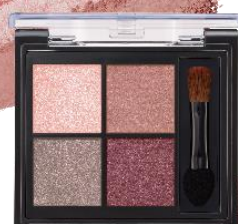
04 ヴァンテージプラム