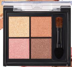
02 アプリコットビジュ