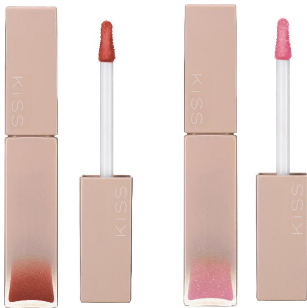
左から リップアーマーX 08-09

“ツヤ×うるおい×落ちにくい”仕上がりで人気の次世代テイントリップ 「リップアーマー」から春らしいシアーな限定カラーが登場！ やさしくピュアなコーラルカラーと、微細ラメが輝くピンクの2色。 唇に色が密着する「透明ジェル膜」が唇をコートし、 つけたての発色が1日中※1続きます。