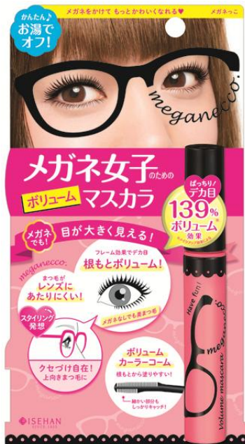
ボリューム カーラーコーム