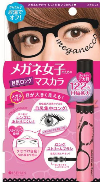
ロング ストリームブラシ