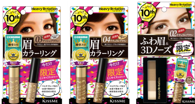
10周年記念 限定セット

限定ミニサイズのカラーリングアイブロウは、携帯用にも、お試用としても使いやすく、増量感があるため、リピーターの方にも嬉しいセットです。