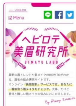
「美眉診断」画面トップ（スマートフォンイメージ）