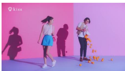
〈出会いは突然に篇〉