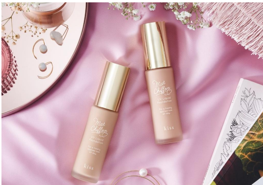
(画像はイメージです)

テカらない、くずれないと絶大な人気を誇るkissのマットシフォンシリーズから、つけた瞬間、肌にぴたっと密着し1日中※ 1 くずれにくい耐久リキッドファンデが登場！肌悩みをしっかりカバーしながら、時間が止まったようなつけたての美しい仕上がりを長時間キープ。なめらかで均一に整った自然な美肌へ導きます。全5色のカラーラインアップで、肌色に合ったファンデーション選びが叶います。