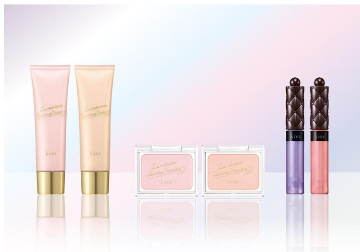
(画像左から ルミナスニュアンスベース 01・02、ルミナスオーロラパウダー 01・02、ニュアンスラスターグロスX 01・02)