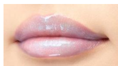
X 01 Cosmic Ray