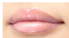
X 02 Romantica