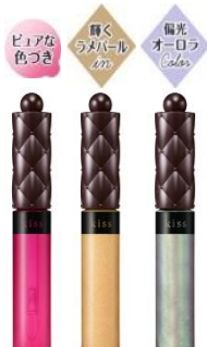
画像左から ニュアンスラスターグロス 02-04-10