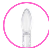
やわらかスパチュラタイプ