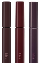
キス ラスティング カールマスカラ (2021年8月2日新発売)