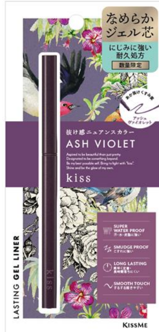
02 ASH VIOLET