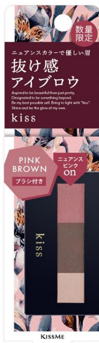
01 PINK BROWN

いつものメイクにひとさじの隠し味のようなアクセントをきかせることができる3色を配色したパレット。 髪色やその日のメイクに合わせてブレンドし、色味を調整することで自分らしい表現を楽しめる アイブロウパウダーです。眉カラーアイテムをまだ使ったことのない方にもオススメ。 肌なじみの良いカラーで、自然な美眉へ。ニュアンスカラーで抜け感のあるおしゃれ顔を叶えます。