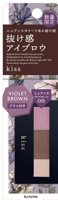
02 VIOLET BROWN