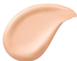
01 ローズ ピンクよりで 明るいオークル