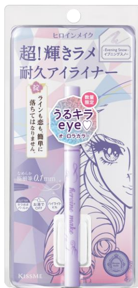
08 イブニングスノー