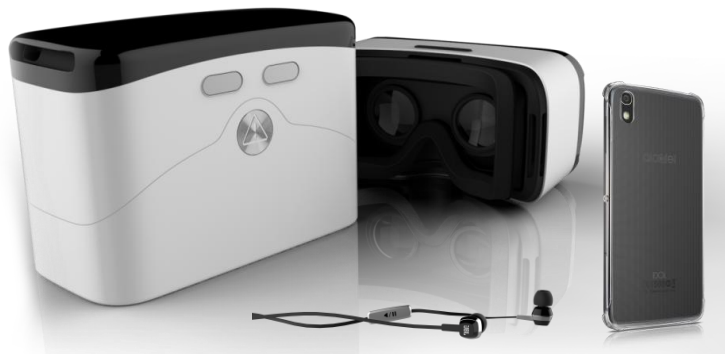
JBLイヤホン、クリアシェルケース付き