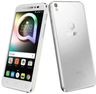
ピュア・ホワイト

Alcatelの強みであるスタイリッシュなデザインを継承したプレミアムモデル「SHINE LITE」は、2.5Dの両面ガラスを使用し、高級感のある綺麗なフォルムを実現しています。指紋認証によるクイック起動でスマートな操作が可能な他、重要ファイルをセキュアに保管することが可能です。簡単で楽しい自撮り機能を充実させた、スマホでの写真撮影を楽しむ10代～20代の若者に最適なモデルです。