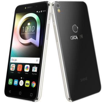
プライム・ブラック