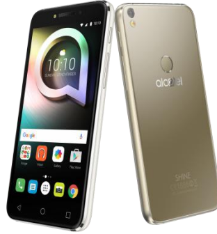
サテン・ゴールド