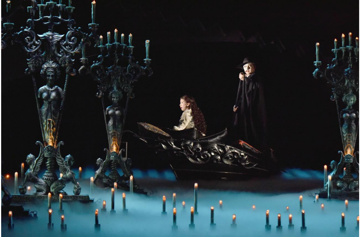
by arrangement with The Really Useful Group Limited DESIGNED BY MARIA BJÖRNSON