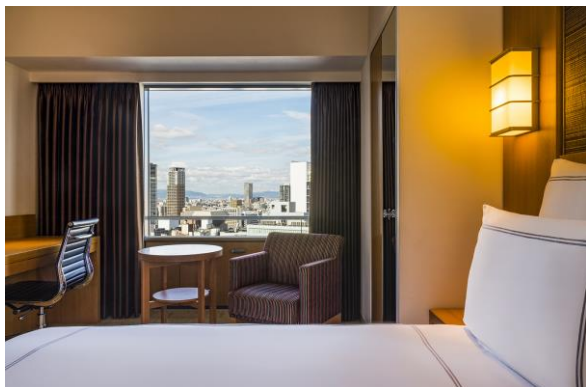
スイス アドバンテージ ルーム クイーン

観劇やお食事の後のご宿泊を特別料金でご利用いただけます。特別料金の対象は、スイス アドバンテージ ルーム、スイス セレクト ルーム、スイス エグゼクティブ ルーム、ジュニア 스위트、デラックス 스위트の5タイプです。スイス アドバンテージ ルーム クイーンには、¥10,000 でご宿泊いただけます。