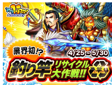
キャンペーンビジュアル