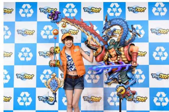
フォトセッション時