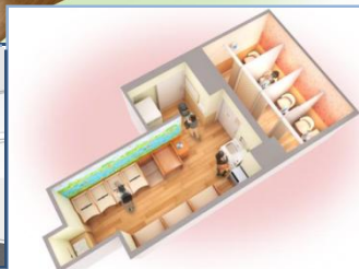
【サービスイメージ】