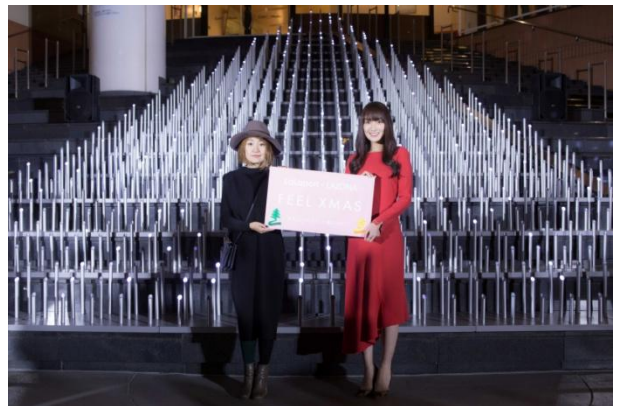
フォトセッションの様子