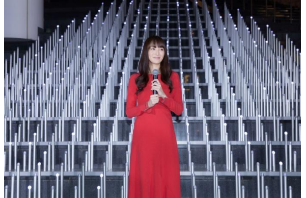
ご家族との思い出を語る高梨さん