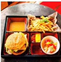
SLAMS BURGER HOUSE

【出店店舗】 ・ SLAMS BURGER HOUSE ・ 元祖インドロール Frankie ・ GOOD FORTUNE FACTORY