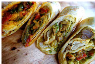
元祖インドロール Frankie