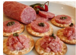
GOOD FORTUNE FACTORY