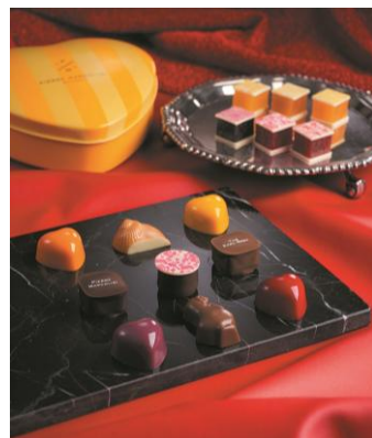
ピエールマルコリーニ

ハイクラウン8本セット(1箱/8本入)・・・2,160円(税込) ※各1本257円(税込) 内容：1964年当時のレシピをもとに作り上げたハイクラウン。8種類の色鮮やかなフレーバーと、厳選されたカカオ豆から生まれたルビーカカオを販売。