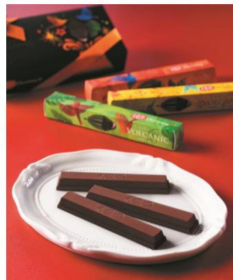
キットカットショコラトリー

焙じ茶と楽しむショコラ/緑茶と楽しむショコラ/和紅茶と楽しむショコラ (各1箱/6個入)・・・各1,296円(税込) 内容：日本のSHIKI (四季・色・式) を表現する「セゾン ド セツコ」がお届けする、バレンタインのとおきショコラ。「お茶と楽しむ日本のショコラ」をテーマにした3種類の味わいは、お茶とともに優雅な時間をお楽しみいただけます。