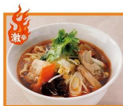
4階 チャイニーズレストラン西安餃子 「麻辣刀削麺」