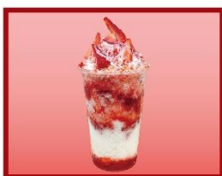
2階 千成屋珈琲 「けずりいちごRED」