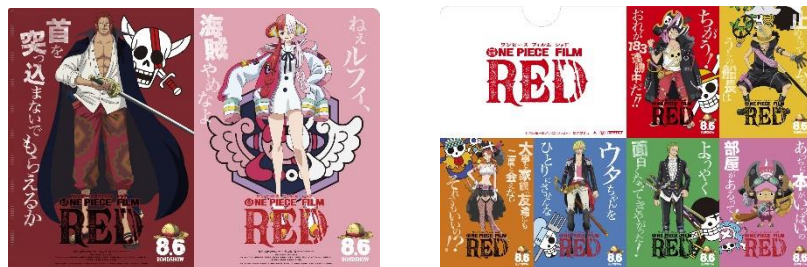
クリアファイルデザイン