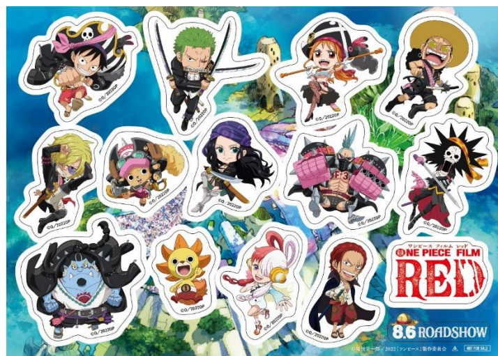
ステッカーデザイン