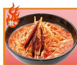
1階 京鼎樓小館 「麻辣担々麺」