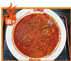
4階 辛麺屋 栢元 「元祖辛麺 50辛」