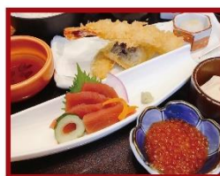
4階 板前ごはん 音音 「北海道いくら 本鮪 刺身と天婦羅御膳」