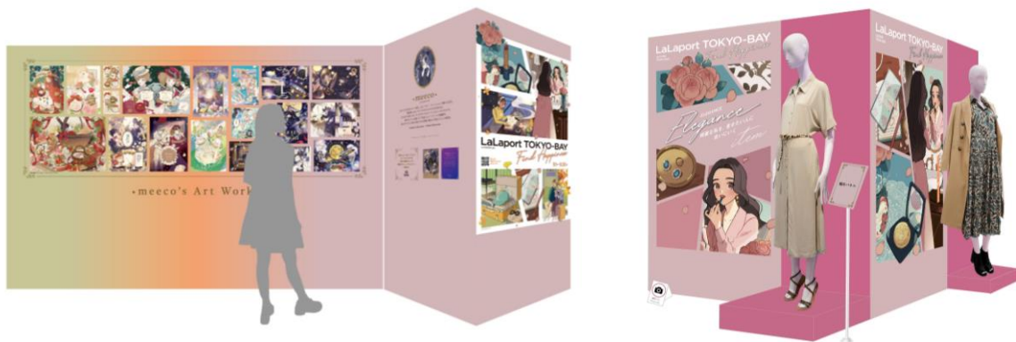
※画像はイメージです。

さらに、エリアを訪れた方には「meeco」のイラストが描かれたオリジナルカードがゲットできます。※なくなり次第終了