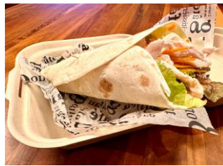
アジアンサラダチキンラップ