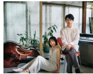
アーティスト：soraya 開催時間19:00～