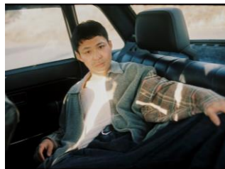
アーティスト：眞名子新 開催時間17:00～