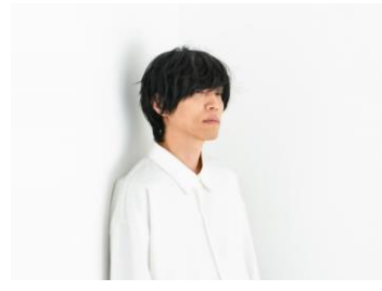
アーティスト：内澤崇仁(androp) 開催時間17:00～