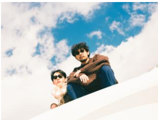
アーティスト：MIZ 開催時間14:00～