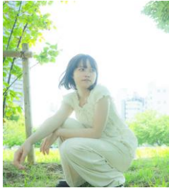
アーティスト：あい(ハク。) 開催時間14:00～