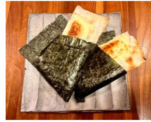
しらすチーズ海苔巻