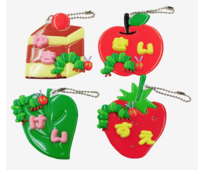
おなまえホルダーイメージ

みついショッピングパーク キッズクラブ会員様限定 先着200名様※10時より整理券配布 ※開催時間等詳細はラゾーナ川崎プラザホームページにて ご確認ください。