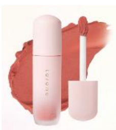
2階 Cosme Kitchen

ラゾーナ川崎プラザ館内の店舗がオススメする春コスメやスキンケアアイテム、ビューティーメニューをご紹介します。詳細は施設特設ウェブサイトや館内ポスターをご確認ください。※画像は一部でイメージです。