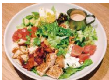
2階 RHC CAFE