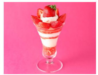
2階 資生堂パーラー サロン・ド・カフェ