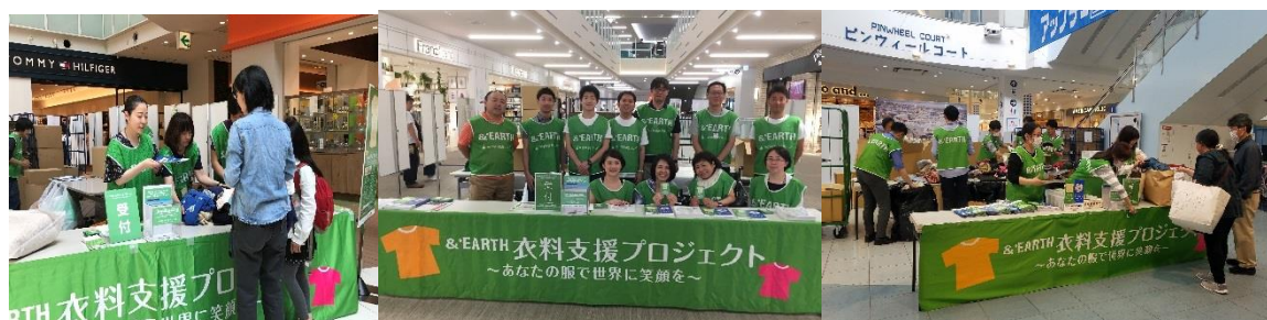
2018年5月（第19回）実施時の様子

当社グループの商業施設では、「Growing Together」の事業理念に基づき、地域のお客さまとともに成長し、ともに豊かになる社会をめざして、環境推進・社会貢献活動を続けてまいります。