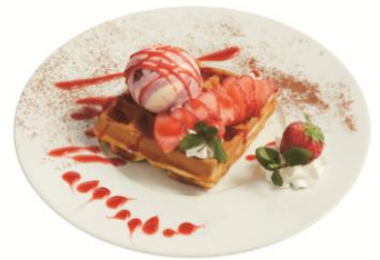
栃木県産いちごのワッフル (ベル・オーブ)