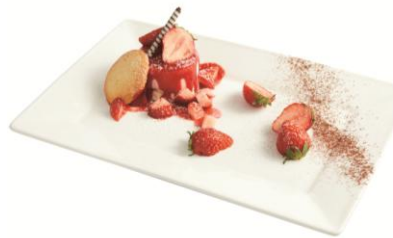
いちごとピスタチオの二層仕立てのムース 自家製ラングドシャ添え (Trattoria Pizzeria LOGiC Marina Grande)