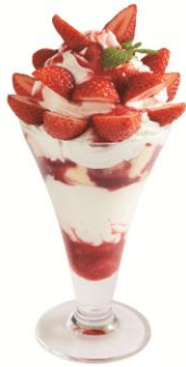
莓づくしパフェ (ダッキーダックオンザビーチ)