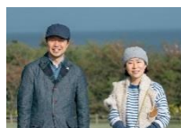
BACCO design & illustration 静岡県田方郡に移住し、静岡東部を拠点に活動