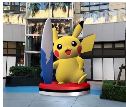
※イラスト・写真はイメージです。

※天候等の都合により、「でっかい! なみのりピカチュウ」のモニュメント設置日が変更になる場合がございます。あらかじめご了承ください。