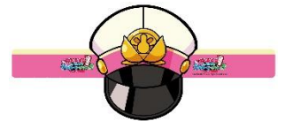
オリジナルサンバイザー