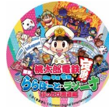
オリジナルステッカー