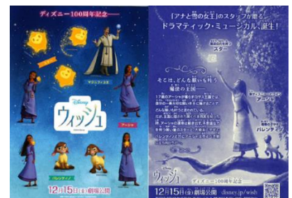
『ウィッシュ』オリジナルシール

開催期間：2023年12月15日(金)～12月25日(月) 開催施設：三井ショッピングパークららぽーと 7施設 (TOKYO-BAY、柏の葉、富士見、横浜、豊洲、磐田、福岡)