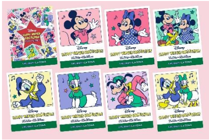
■ ステッカーイメージ

期間中、対象店舗にて対象商品もしくは、ディズニー関連商品をお買い上げいただいた方に、本キャンペーン限定ステッカーをプレゼント。さらに、先行限定販売商品をお買い上げの方には、ショッピングバッグと缶バッジもプレゼントいたします。本キャンペーンでしか手に入らない限定グッズです。 (缶バッジはラゾーナ川崎プラザでのPOP UP STOREもしくは&mallの期間限定ショップにて購入可能です)