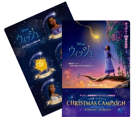
『ウィッシュ』オリジナルクリアファイル

購入対象期間：2023年11月27日(月)～12月25日(月) ノベルティ引換期間：2023年11月27日(月)～2024年1月8日(月・祝) ※なくなり次第終了となります。