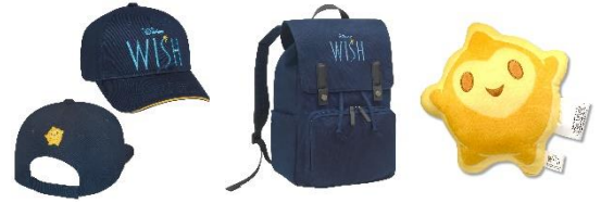
『ウィッシュ』オリジナルグッズ一例

三井ショッピングパークポイント公式LINEで「キーワード」をつぶやくと、抽選で『ウィッシュ』オリジナルグッズが当たります。