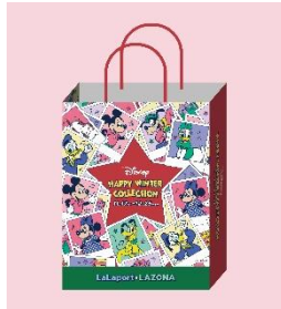
■ ショッピングバッグイメージ