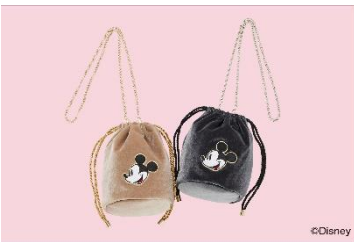
RODEO CROWNS WIDE BOWL