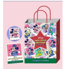
ららぽーと・ラゾーナ 限定ノベルティ

対象の商品お買い上げで、ららぽーと・ラゾーナ限定ノベルティ「ステッカー・ショッピングバッグ・缶バッジ」をプレゼント！