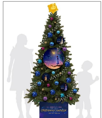
クリスマスツリーイメージ

クリスマスツリーの頭頂部には、劇中に登場するキャラクター「スター」が飾られ、まるで来館した方の願いをかなえてくれるかのようです。