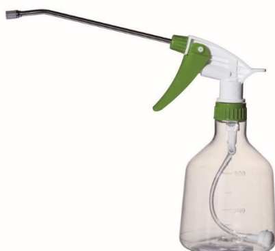
〈振り子タイプロングノズル〉