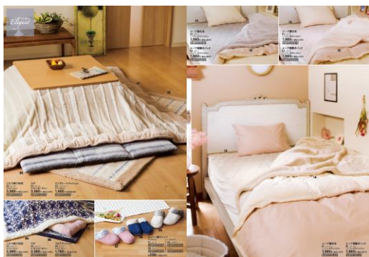
エレガント コーディネートイメージ

〈2017 年秋冬テーマ① ホームメイド〉 主にファミリー層に向け、機能性とお求めやすい価格設定、家族の団欒をイメージしたコーディネート。