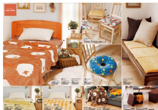
ホームメイド コーディネートイメージ

〈2017 年秋冬テーマ③ クラシック〉 世代や性別を越えて、流行に左右されることなく好みのスタイルを貫ける商品を充実させた、インテリアに馴染むベーシックなコーディネート。