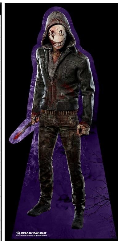
パネルのデザインイメージ