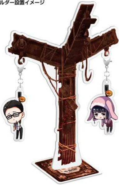
フック型アクリルスタンド アクリルキーホルダー設置イメージ