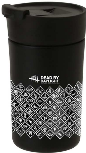
パークタンブラー 2,530 円(税込)