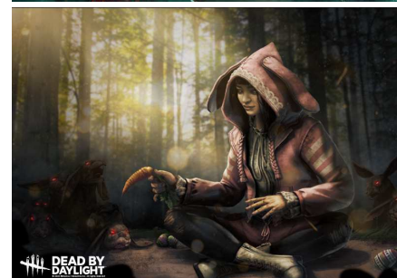
上画像:ランチョンマットデザイン例