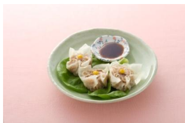
<試食品>しらたき焼売