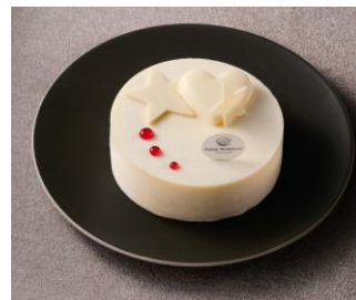
ピエール マルコリーニ ノエルドゥピエール 2011 ブラン