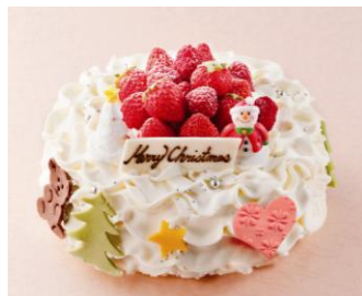
アニバーサリー Handmade Christmas Cake