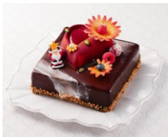
マンダリン オリエンタル 東京 プログレッシブ