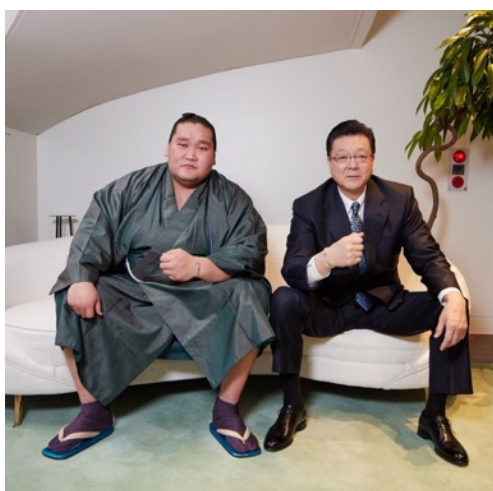
横綱 照ノ富士関 伊勢ヶ浜親方